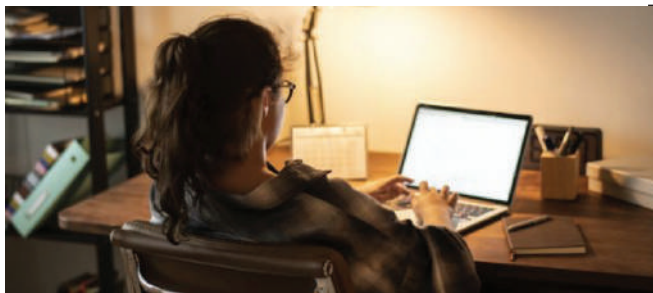
STUDENTI U DOBA KORONE

U razdoblju kada smo šetnje špicom zamijenili šetnjom mislima u sigurnosti svog doma, socijalna interakcija pala je na minimum. Ako ste introvert, onda vas sve ovo nije izbacilo iz takta, čak bismo mogli reći da vam je situacija i pošla za rukom u nekom pogledu, ali ekstroverti ne dijele istu