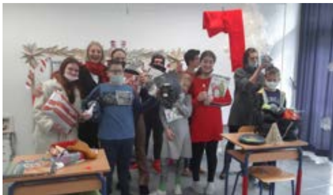
UDRUGA MLADIH — U sklopu humanitarne inicijative #Pokreni Osmijeh!, EFFECTUS udruga mladih odlučila je uljepšati i razveseliti učenike OŠ Prečko prigodnim poklonima. ■