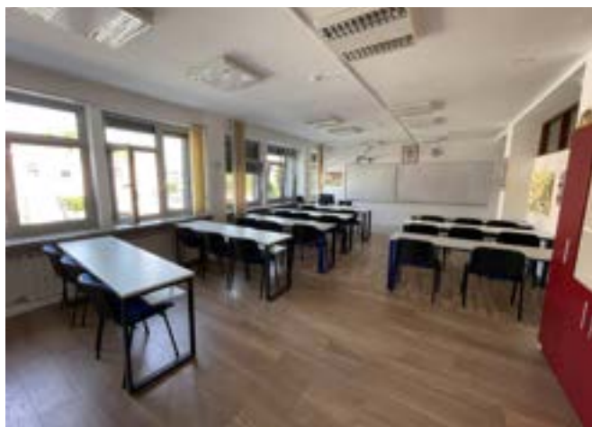
DONACIJA GIMNAZIJI SISAK – posjetili smo školu koja je novu školsku godinu započela u novom prostoru opremljenom donacijom klupa i stolica Effectusa. ■